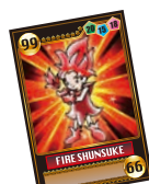
トレーディングカード