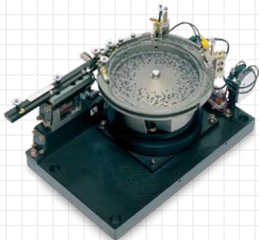
HSE系列 高频迷你零件供料机