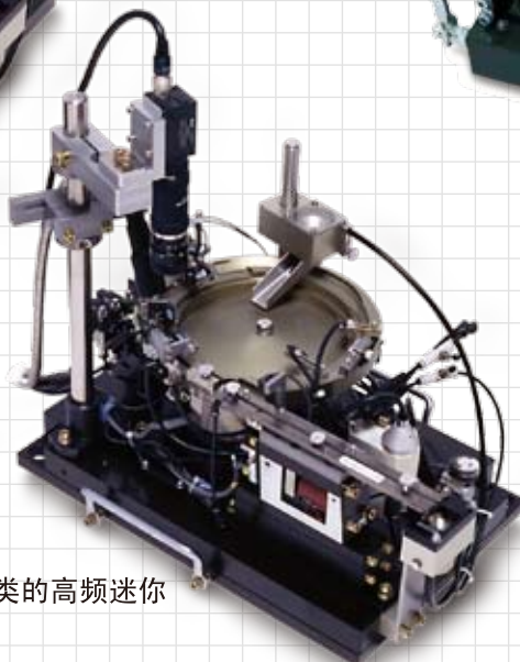
带CCD相机分类的高频迷你零件供料