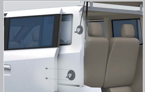
電動スライドドア用電磁クラッチ