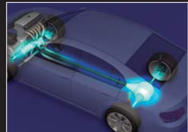
駆動装置用電磁クラッチ