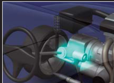
パワーステアリング用電磁クラッチ