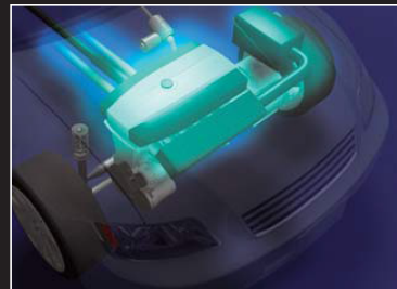
吸排気用電磁クラッチ