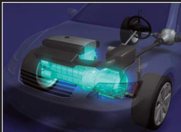
ハイブリッド用電磁クラッチ